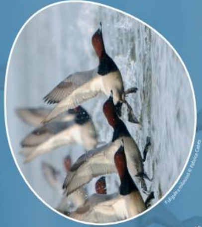
Th. Baudouin / O. P. / P. G. / P. G.

Le comptage international des oiseaux d'eau se veut simultané dans chaque région géographique (Afrique-Eurasie, Asie-Pacifique, Caraïbes, ...). Il se déroule sur un ou deux jours, historiquement autour de la mi-janvier (fenêtre de 7 jours autour de la mi-janvier selon les contraintes locales). Le comptage se veut un instantané de la répartition des effectifs des populations d'oiseaux d'eau sur les différentes voies de migration. En effet, si les effectifs dénombrés constituent un indicateur de l'état des populations d'oiseaux d'eau, et des habitats utilisés, à l'échelle nationale, ils prennent d'avantage de sens à l'échelle de la voie de migration. Pour rappel, les comptages standardisés de Wetlands International ont débuté en 1967 et ne concernaient à l'origine que le gibier d'eau, c'est-à-dire les anatidés et la foulque (et les limicoles à partir de 1978). Ils se sont ensuite élargis progressivement à l'ensemble des espèces d'oiseaux d'eau (Laridés et espèces exogènes comprises).